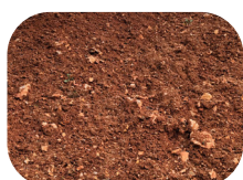
Argile à silex