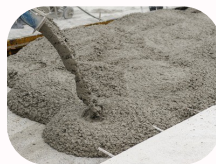
Béton Prêt à l'emploi