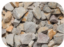
Cailloux drainage (20/40)