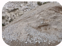
Éco grave (0/80 recyclé pour chemin d'accès)