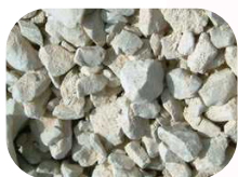
Grave recyclée (0/25, 0.31/5, 0/80)