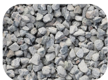
Graviers de différentes granulométries/ couleurs